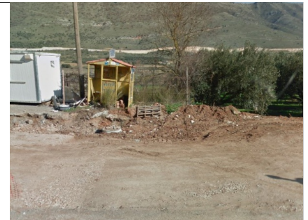
Φωτογραφία Σημείου Τοποθέτησης Στεγάστρου