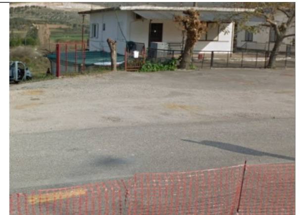
Φωτογραφία Σημείου Τοποθέτησης Στεγάστρου