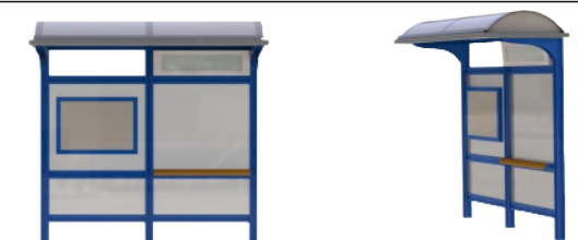
Τύπος Προτεινόμενου Στεγάστρου

Διερχόμενες Γραμμές Αστικής Συγκοινωνίας