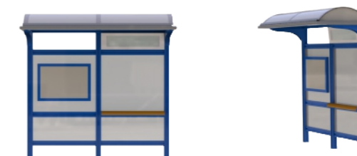
Τύπος Προτεινόμενου Στεγάστρου

Διερχόμενες Γραμμές Αστικής Συγκοινωνίας