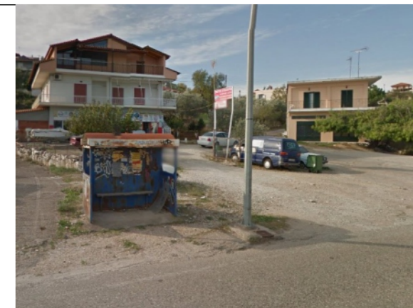
Φωτογραφία Σημείου Τοποθέτησης Στεγάστρου