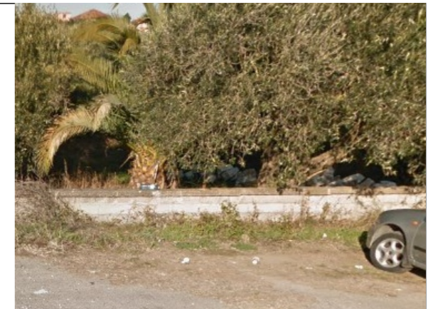
Φωτογραφία Σημείου Τοποθέτησης Στεγάστρου