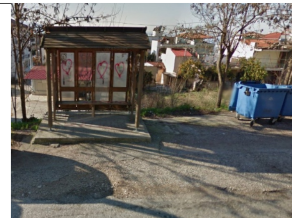
Φωτογραφία Σημείου Τοποθέτησης Στεγάστρου