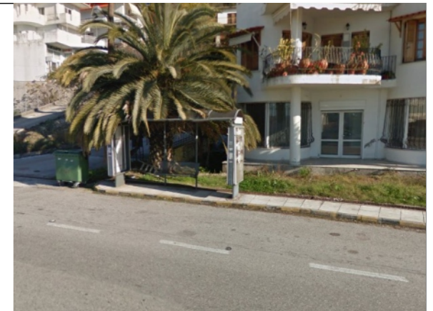
Φωτογραφία Σημείου Τοποθέτησης Στεγάστρου