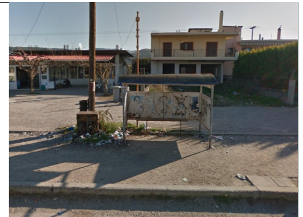
Φωτογραφία Σημείου Τοποθέτησης Στεγάστρου