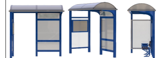
Τύπος Προτεινόμενου Στεγάστρου

Διερχόμενες Γραμμές Αστικής Συγκοινωνίας