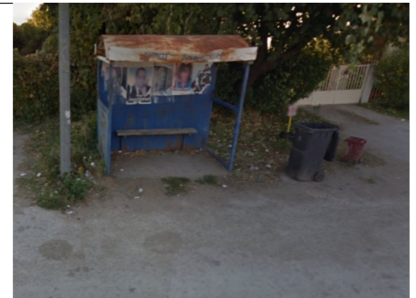
Φωτογραφία Σημείου Τοποθέτησης Στεγάστρου