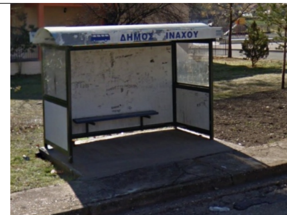
Φωτογραφία Σημείου Τοποθέτησης Στεγάστρου