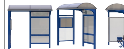
Τύπος Προτεινόμενου Στεγάστρου

Διερχόμενες Γραμμές Αστικής Συγκοινωνίας