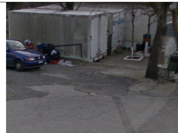
Φωτογραφία Σημείου Τοποθέτησης Στεγάστρου